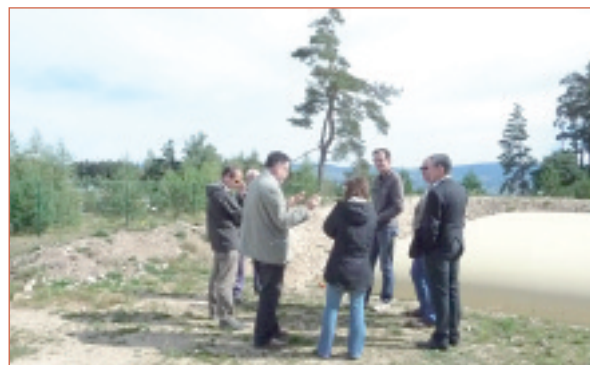
Voierie rurale, protection des captages d'eau, à qui s'adresser ?

Le porteur de projet saisit l'AIDL en amont du projet d'aménagement qu'il envisage de mettre en œuvre. Il obtient un premier avis gratuit et une aide pour définir le cahier des charges de la mission de l'AIDL.