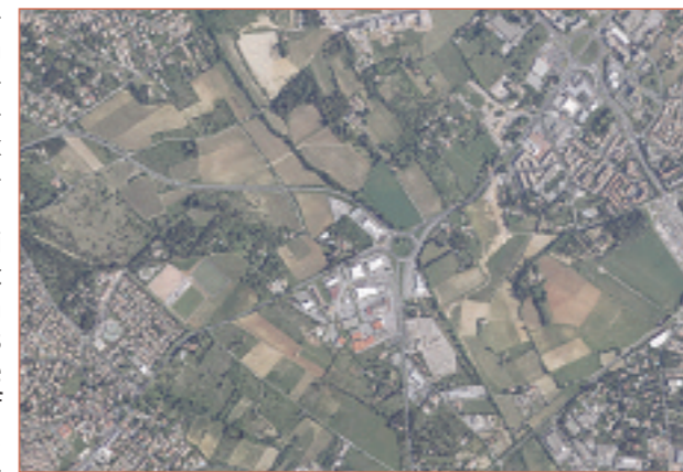
L'étalement urbain : une réalité en Languedoc-Roussillon.