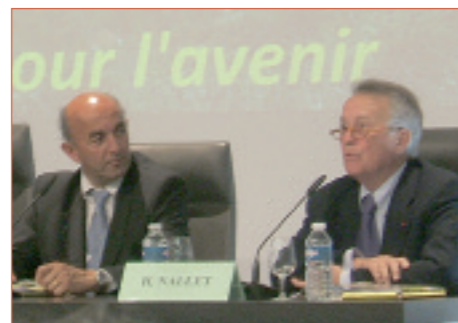
Henri Nallet (à d.) : "Il faut un vrai débat politique national sur ce que nous voulons faire de notre terre". Il proposera aux candidats aux présidentielles de s'engager sur ce point.

Le foncier ne doit pas être la préoccupation des seuls agriculteurs ou des seules collectivités territoriales, il faut un vrai débat politique national sur le foncier, a dit l'ancien ministre de l'Agriculture, qui était invité par la Safer Languedoc-Roussillon à l'occasion de ses 50 ans (le 21 juin à Lattes).