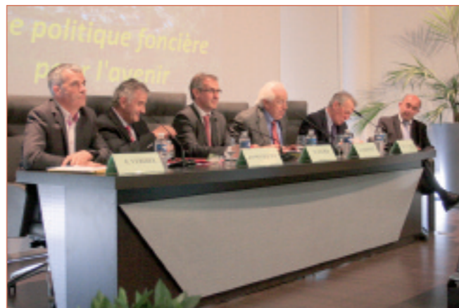
Les élus des collectivités ont participé aux débats.

H. Nallet fait une proposition : élaborer, dans chaque région, un programme foncier à 25 ans, "avec des axes de politique foncière contraignants, opposables". L'un de ces axes pourrait être de protéger les terres de haut niveau agronomique contre l'urbanisation.